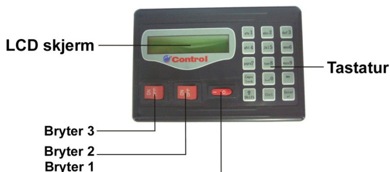
Figur 1 Kontroller og tastatur